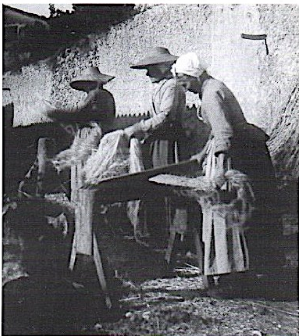
Fig. 2 Passage du chanvre au bregon, St Martin de Brômes (04), vers 1870.

Pour obtenir des fibres en rubans fins, on casse la partie cellulosique. Pour se faire, on martèle à l'aide d'un maillet sur un plot creusé, la coustouluoïro , les mas de chanvre (fig. 1). Le passage au bregon permet ensuite d'ouvrir les fibres de chanvre avant d'utiliser des sérans, les brustio , en passant du plus grossier, au peigne intermédiaire et enfin au plus fin. (fig.2)