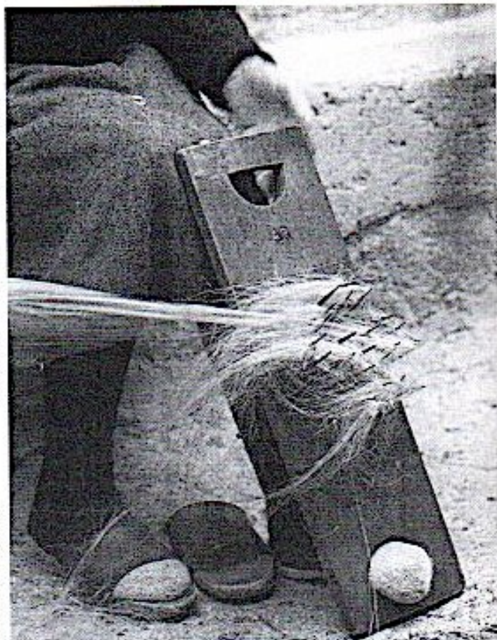
Fig. 3 Technique d'utilisation du brustio fin.

On porte au tisserand un pain et une bouteille de vin pour le jour où l'on va ourdir, car ce jour là, le tisserand ne gagne rien. Quand la pièce est finie l'on rapporte de nouveau un pain et une bouteille de vin puis on paye les cannes de toile faites. Le coût d'une canne était de 20 sous au XIX ème siècle, mais le tisserand peut aussi bien être payé en nature : en blé, en bois, en surface de labour ... Un tisserand qui travaille sans s'arrêter et travaillant bien réalise jusqu'à trois cannes par jour, sur 15 heures de travail.