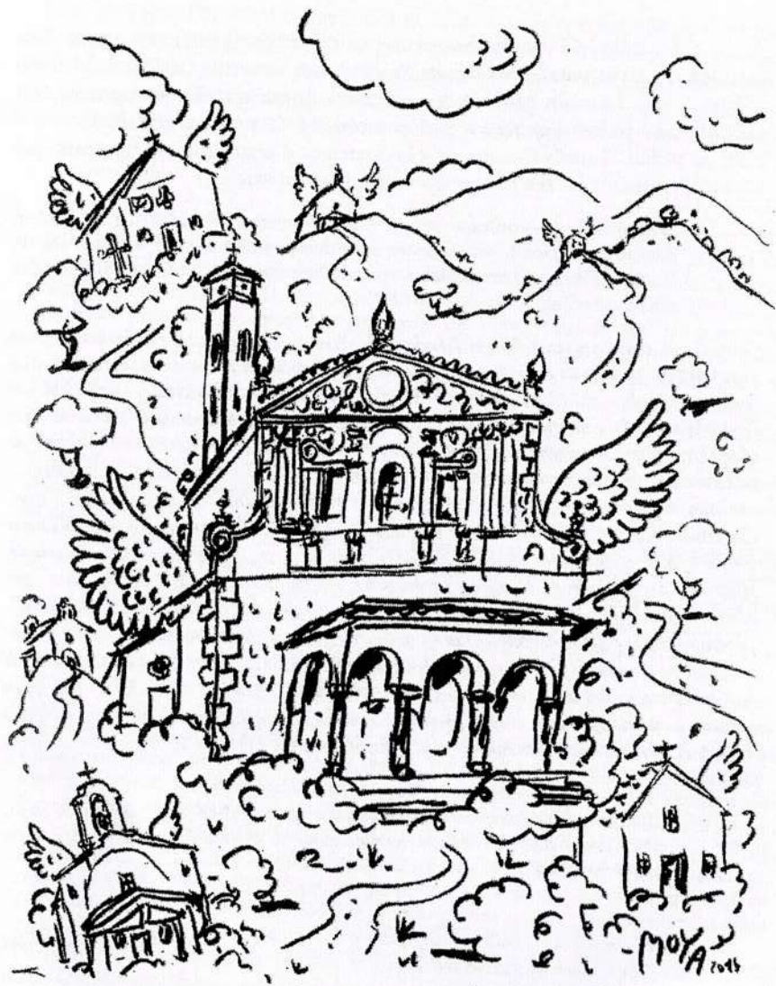
Patrick Moya, encre sur papier, 2014