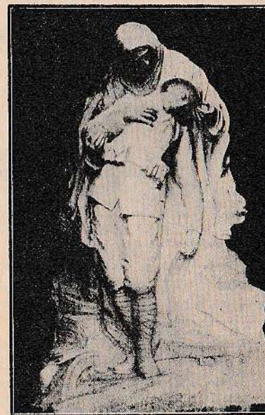
La mort du Héros (Campo Santo de Gênes)

Cet acte de foi, d'union patriotique, fut magnifiquement récompensé et auréolé par la présence de nombreuses personnalités venues, exprès, apporter, ce jour, à Beuil, le