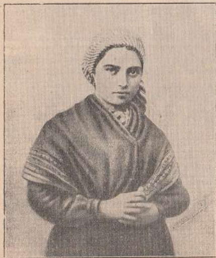
SAINTE BERNADETTE

Le 11 février 1858, la Très Sainte Vierge Marie, Mère de Dieu, apparut vers midi, heure de l'Angelus, dans le creux de la Roche Massabielle, sur le bord du Gave, à la petite Bernadette Soubirous, de Lourdes. Le 25 mars, elle lui révéla son nom : Je suis l'Immaculée-Conception. Et depuis trois quarts de siècle, toute la terre va aux pieds de Notre-Dame de Lourdes chercher les grâces du ciel.